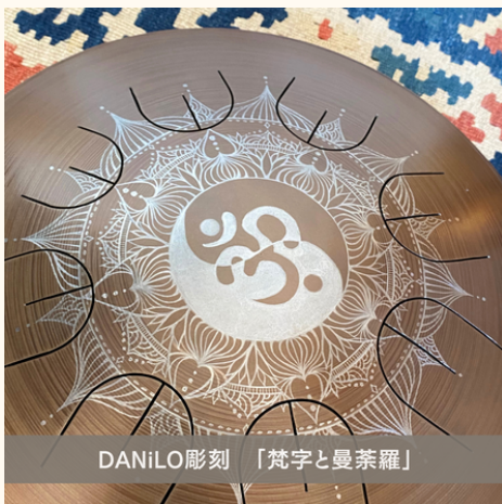
DANiLO彫刻 「梵字と曼荼羅」