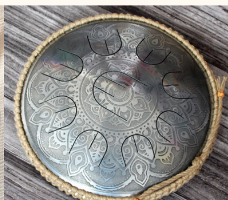
ウォーターリリー

こちらの模様はレーザー加工で制作されていますが、ウクライナ情勢の影響による電力供給の不安定さにより、仕上りの凹凸には個体差が生じる場合があります。あらかじめご了承のうえ、ご注文ください。