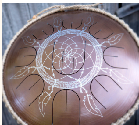
ドリームキャッチャー

一点一点、メーカーによる手彫り制作のため、仕上がりには個体差があります。あらかじめご了承のうえ、ご注文ください。