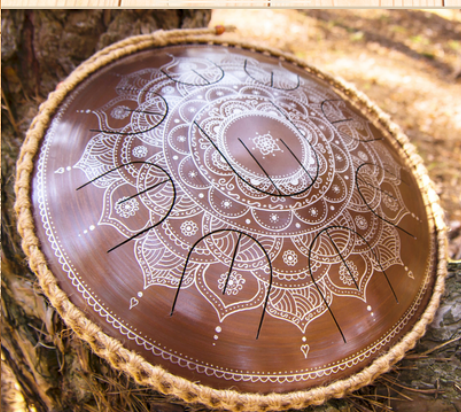
フローズンフラワー

一点一点、メーカーによる手彫り制作のため、仕上がりには個体差があります。あらかじめご了承のうえ、ご注文ください。