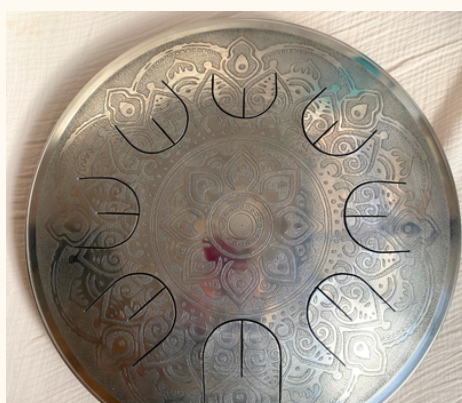
ウォーターリリー

こちらの模様はレーザー加工で制作されていますが、ウクライナ情勢の影響による電力供給の不安定さにより、仕上りの凹凸には個体差が生じる場合があります。あらかじめご了承のうえ、ご注文ください。