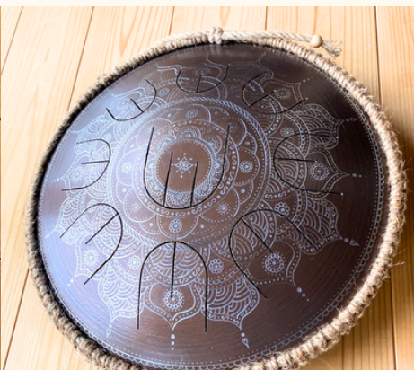
フローズンフラワー

一点一点、メーカーによる手彫り制作のため、仕上がりには個体差があります。あらかじめご了承のうえ、ご注文ください。