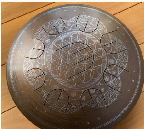
フラワーオブライフ

一点一点、メーカーによる手彫り制作のため、仕上がりには個体差があります。あらかじめご了承のうえ、ご注文ください。