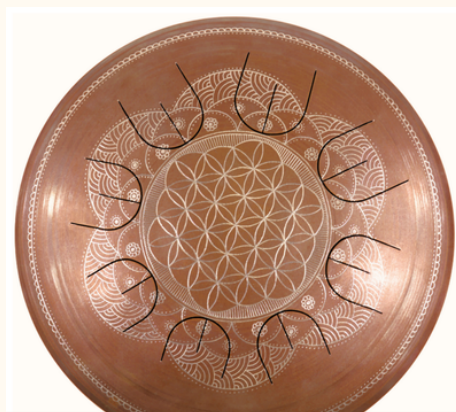
フラワーオブライフ

一点一点、メーカーによる手彫り制作のため、仕上がりには個体差があります。あらかじめご了承のうえ、ご注文ください。