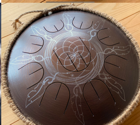
ドリームキャッチャー

一点一点、メーカーによる手彫り制作のため、仕上がりには個体差があります。あらかじめご了承のうえ、ご注文ください。