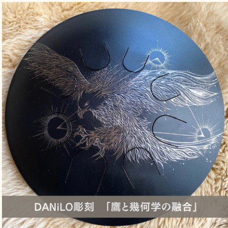
DANiLO彫刻 「鷹と幾何学の融合」