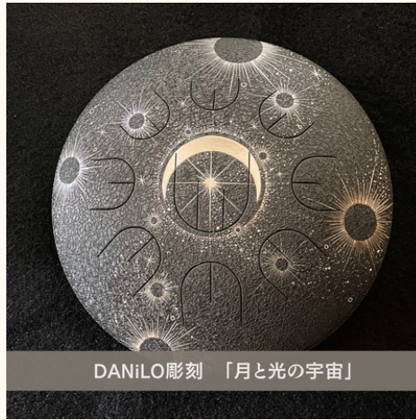
DANiLO彫刻 「月と光の宇宙」