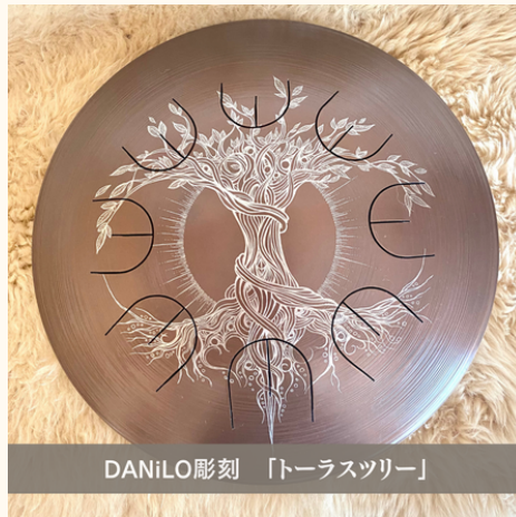
DANiLO彫刻 「トラスツリー」